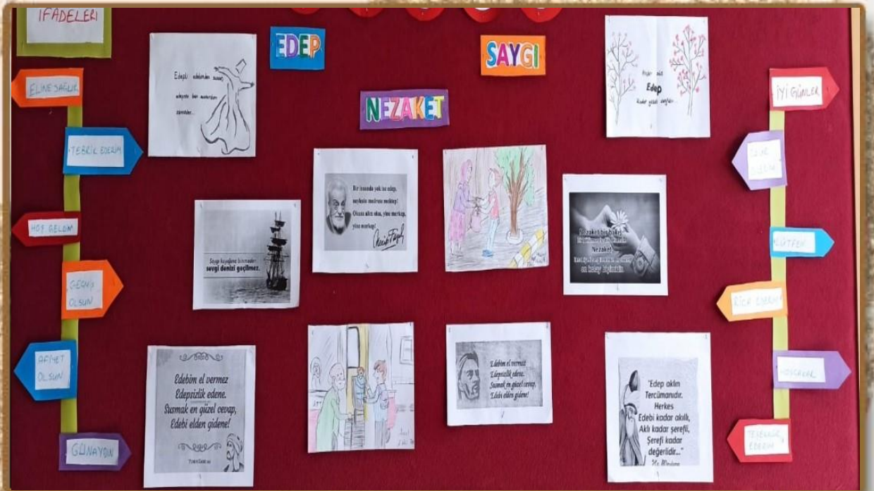
ÇEDES ETKİNLİK PANOMUZ