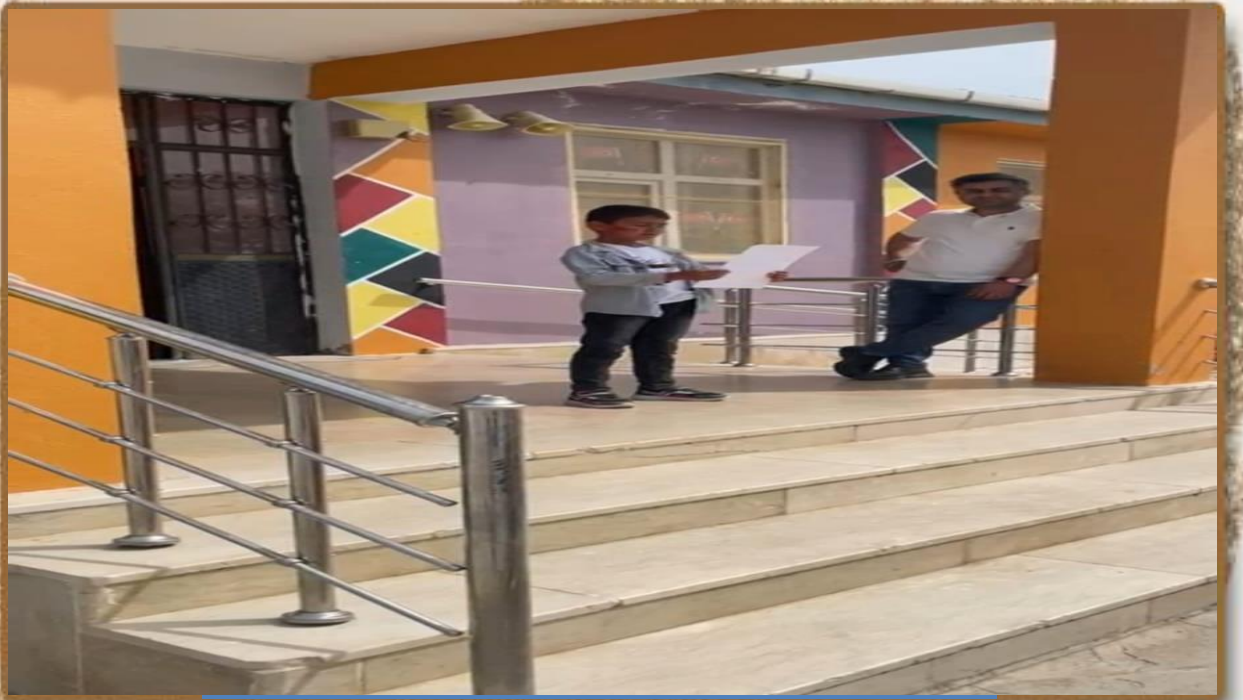
23 NİSAN ULUSAL EĞEENLİK VE ÇOCUK BAYRAMI