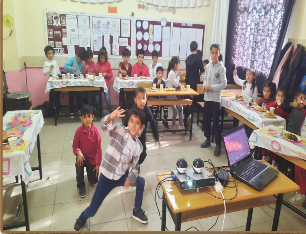
YERLİ MALİ HAFTASI