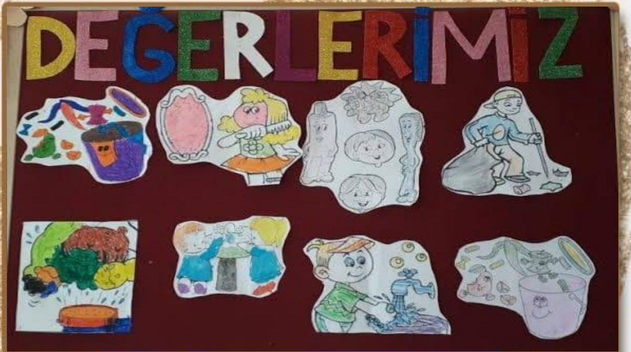
TEMİZLİK VE DÜZEN KONULU ETKİNLİĞİMİZ