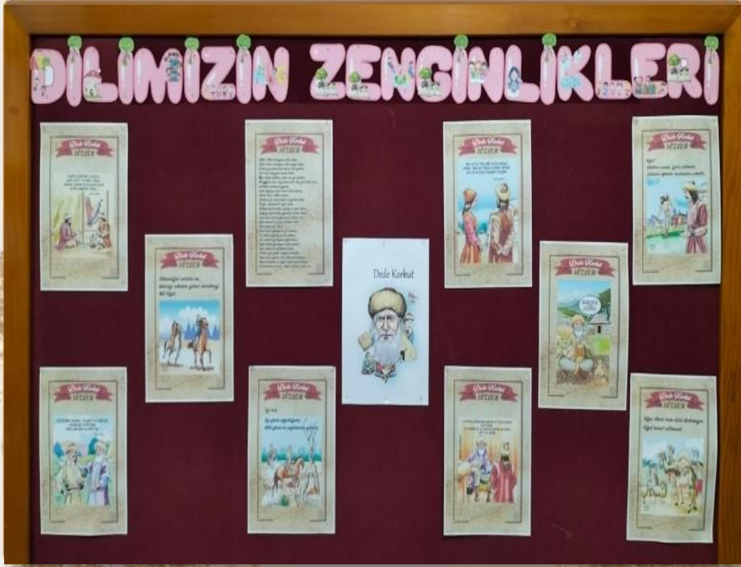
DİLİMİZİN ZENGİNLİKLERİ ETKİNLİK PANOMUZ