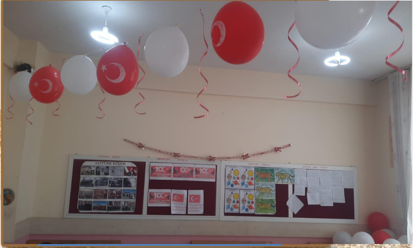
.29 Ekim Cumhuriyet Bayramı.